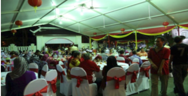
Rajah 4: Sambutan Tahun Baru Cina 2013

memeluk agama Islam bermaksud 'masuk Melayu'. Justeru, sambutan Tahun Baru Cina, majlis minum teh, pemberian ang pau yang masih boleh diadakan ini menunjukkan sifat keterbukaan Islam yang tidak menolak sesuatu yang tidak bertentangan dengan syariat.