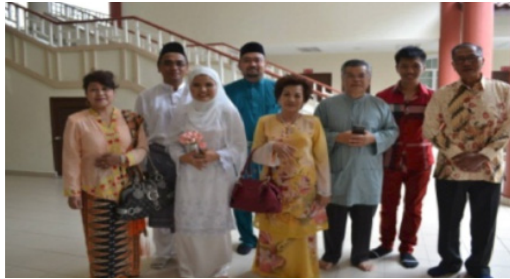
Rajah 3: Majlis Perkahwinan Ahli MACMA Cawangan Negeri Sembilan

Pada bulan Jun 2013, MACMA Cawangan Negeri Sembilan telah memperkenalkan sistem keluarga angkat dalam kalangan ahli MACMA. Ia bertujuan untuk memastikan mereka tidak merasa rendah diri dan terasing setelah bergelar saudara baru. Dengan sistem keluarga angkat ini, keluarga tersebut dapat membimbing saudara baru untuk menjalani kehidupan sebagai seorang Muslim. Keluarga angkat ini juga dapat membantu mualaf menguruskan pernikahan sekiranya terdapat tentangan dari keluarga sendiri.