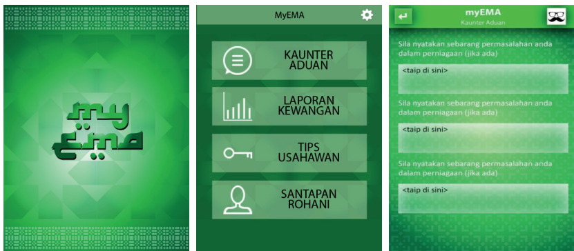
Rajah 2: (a) Paparan Depan, (b) Paparan Kandungan (c) Paparan Masalah

Rajah di bawah menunjukkan beberapa paparan bagi aplikasi MyEMA