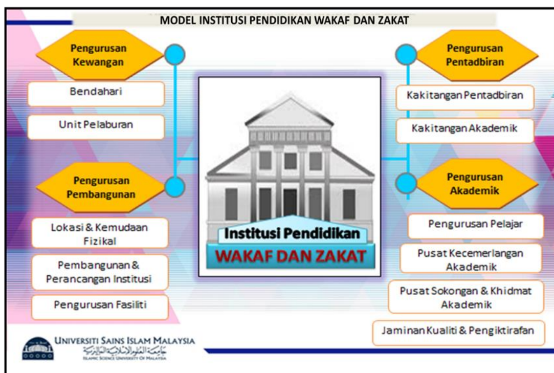
Rajah 1.0: Model Institusi Pendidikan Wakaf dan Zakat

Model Institusi Pendidikan Melalui Sinergi Dana Wakaf dan Zakat merupakan transformasi baharu dalam sistem pendidikan kebangsaan yang diyakini dapat menyelesaikan isu keciciran pelajaran bagi kumpulan kurang bernasib baik di Malaysia. Cadangan penubuhan institusi ini diharapkan dapat membantu semua anak fakir dan miskin di Malaysia mendapat peluang pendidikan dari peringkat rendah hingga menengah seterusnya pengajian tinggi pada masa akan datang dengan terlaksananya pendekatan baru ini. Cadangan penubuhan Institusi Pendidikan Wakaf dan Zakat merangkumi aspek pengurusan pentadbiran, pengurusan kewangan, pengurusan pembangunan dan pengurusan akademik. Kerangka model yang dicadangkan adalah sebagaimana dalam rajah di bawah: