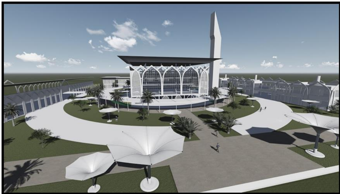
Rajah 2.0: Model Institusi Pendidikan Wakaf dan Zakat

Rekabentuk institusi Pendidikan wakaf dan zakat dibentuk dengan mengambil kira konsep pembinaan masjid al-haram di Mekah. Berikut merupakan kerangka perancangan pembangunan reka bentuk Institusi Pendidikan Melalui Sinergi Dana Wakaf dan Zakat: