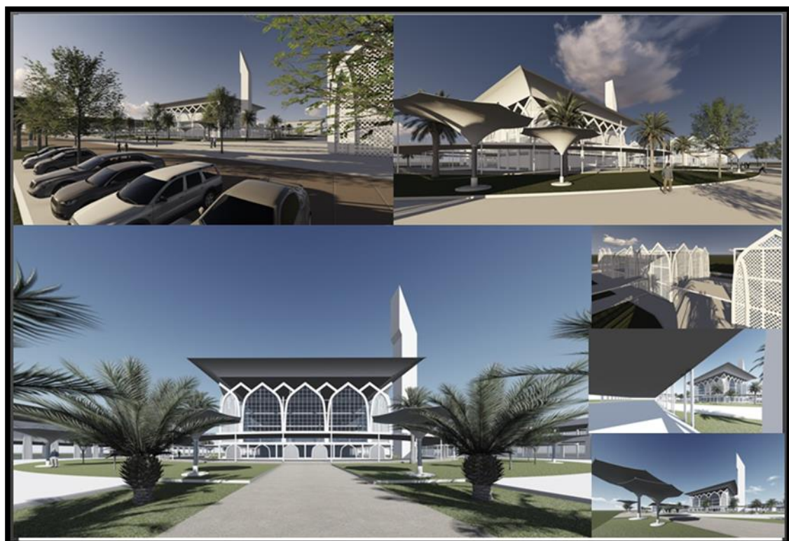
Rajah 4.0: Pandangan Luar Institusi Pendidikan Wakaf dan Zakat