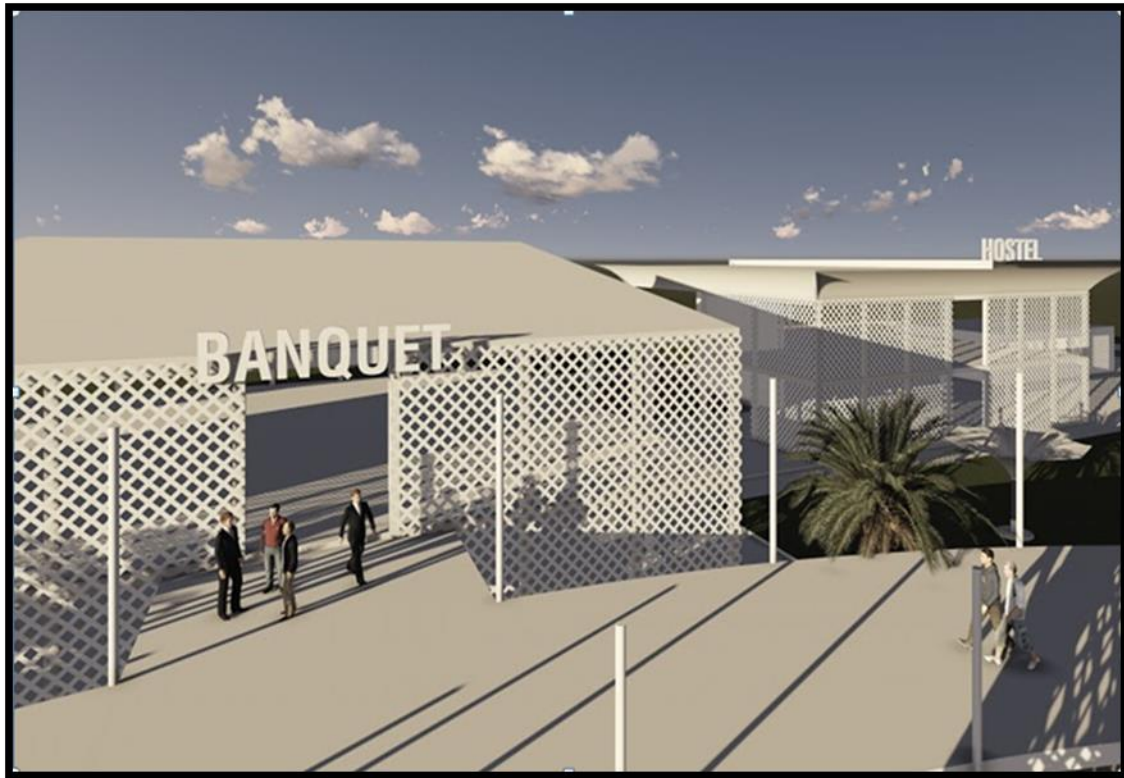
Rajah 5.0: Model Institusi Pendidikan Wakaf dan Zakat

Bangunan utama umpama kaabah ditengah-tengah merupakan bangunan utama pentadbiran dan akademik termasuk masjid. Bangunan utama memiliki 7 tingkat yang terdiri daripada 2 tingkat bahagian pentadbiran, 1 tingkat masjid dan 4 tingkat bahagian akademik.