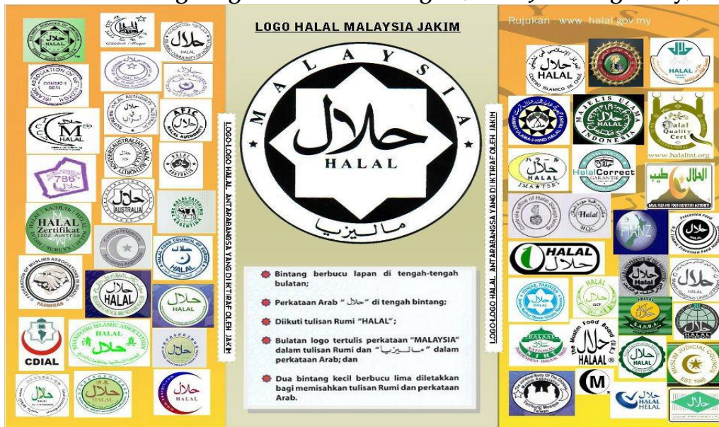
Gambar 3: Logo-logo Halal Antarabangsa