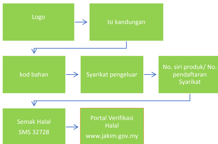
Rajah 1: Model Aplikasi produk halal

Model ini dibina berdasarkan amalan praktikaliti satu kumpulan masyarakat yang memahami al-Quran dan as Sunnah. Tatacara pelaksanaan dan amalan yang praktikal oleh responden seperti mana yang dinyatakan dalam perbahasan metodologi. Data yang dikumpul dengan menggunakan teknik kajian klinikal ( Nik Azis, 1989 ) telah dianalisis dan bincangkan. Hasil perbincangan dari data responden yang dikumpul mengenai Produk Halal secara inklusif, maka rumusannya dapat membentuk satu model yang praktikal, yang boleh digunakan oleh seluruh masyarakat Muslim bagi mengabsahkan kehalalan sesuatu produk sebelum mengkonsuminya. Rajah di bawah adalah satu bentuk model yang dirumuskan dari pengalaman dan amalan praktikaliti responden yang merupakan output kajian ini.