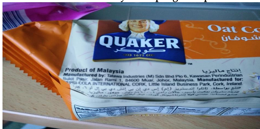
Gambar 5: Contoh Syarikat pengeluar produk

Dengan melihat kepada syarikat pengeluar juga amat penting untuk mengetahui status sesuatu produk. Pengeluar Muslim biasanya dapat dibezakan oleh pengguna dari segi nama syarikat yang didaftarkan seperti, Azmi food Sdn. Bhd., Aishah frozen sdn. Bhd, Pertama sdn bhd, Cik Mah Foods LTD dan sebagainya.