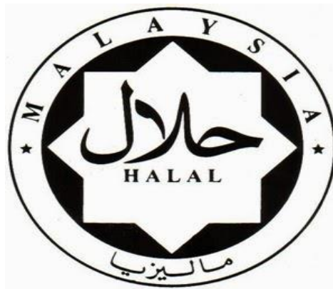
Gambar 1: LOGO HALAL JAKIM ( www.JAKIM.gov.my )

Terdapat beberapa ciri Logo Halal Malaysia yang perlu difahami dan dihayati oleh pengguna, berikut adalah ciri-ciri Logo Halal Malaysia: