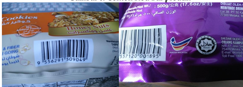
Gambar 6: Contoh Kod Bar produk

Selain itu, nombor pendaftaran produk juga boleh dirujuk, Ini kerana sesetengah produk seperti ubat-ubatan akan melalui ujian makmal. Pengguna dinasihatkan untuk memastikan nombor pendaftaran produk dan pelekat hologram yang tulen. Nombor pendaftaran lazimnya dimulakan dengan 'MAL', diikuti dengan 8 digit nombor dan diakhiri dengan huruf, seperti: MAL 19912098 X.