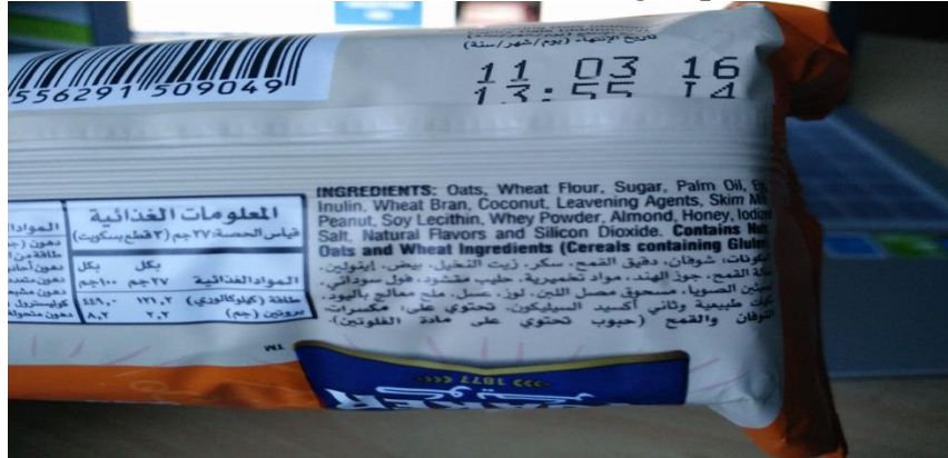
Gambar 4: Contoh isi kandungan produk

Pengguna boleh merujuk kepada isi kandungan atau bahan-bahan yang diolah untuk dibentuk menjadi produk. Ianya tertera di bahagian belakang bungkusan setiap produk.